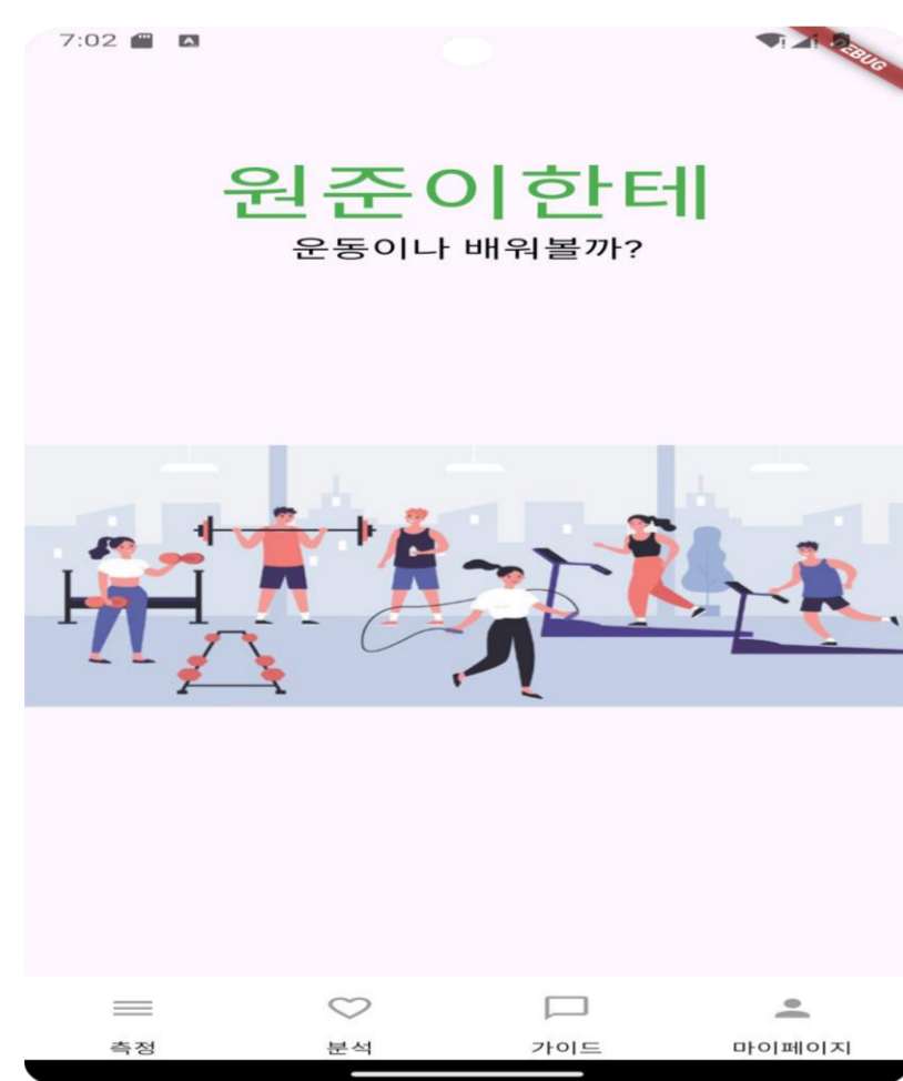
<그림2. 메인 화면>