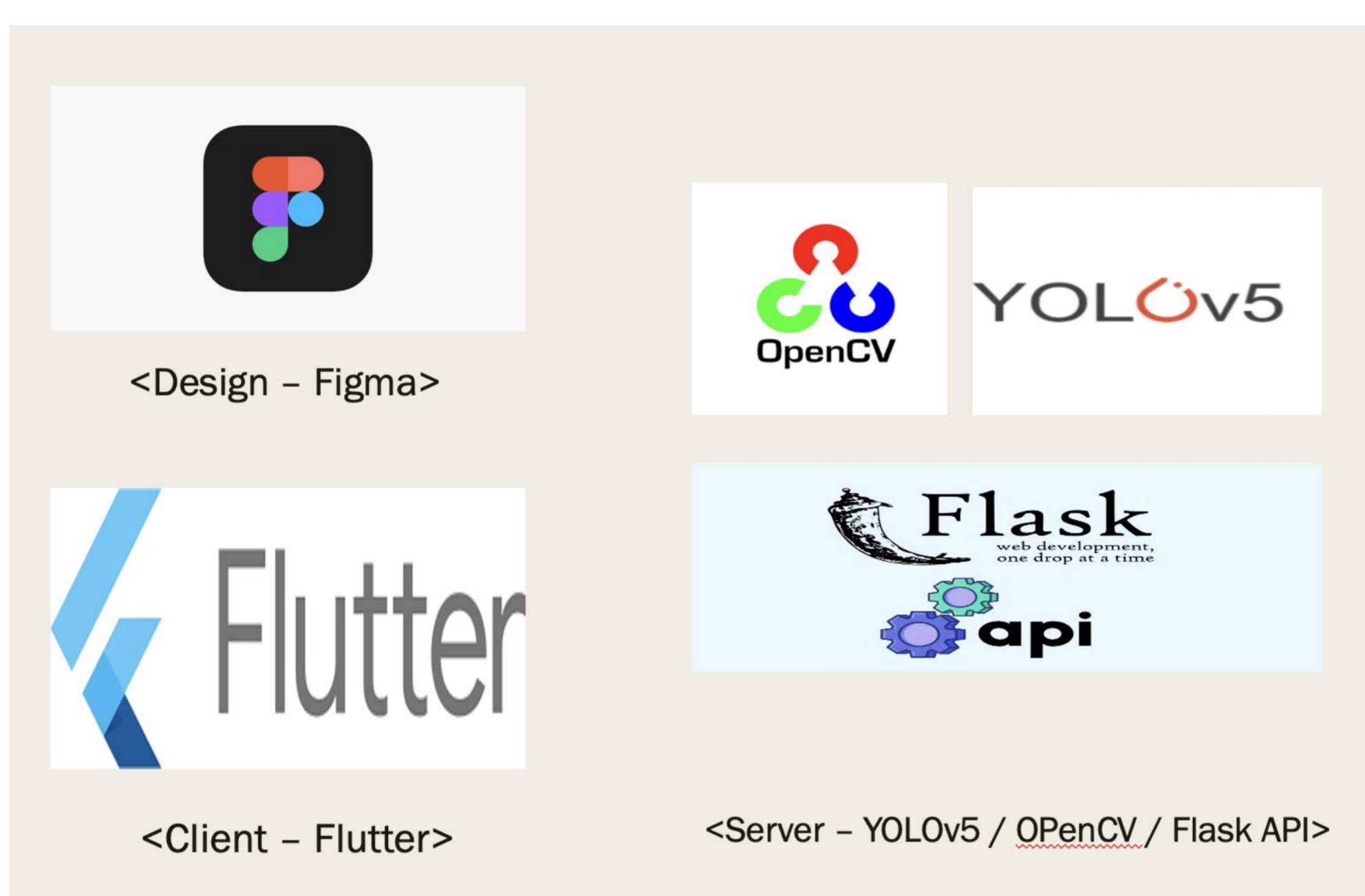
<그림1. 시스템 아키텍처>